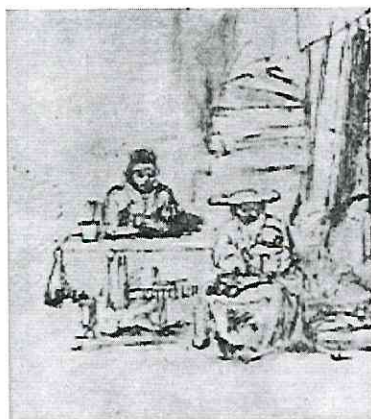
«Sawra Famiglia» (1652 ca.). Vienna, Albertina