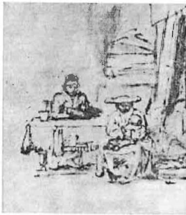
«Santa Famiglia» (1652 ca.) Vienna, Albrina