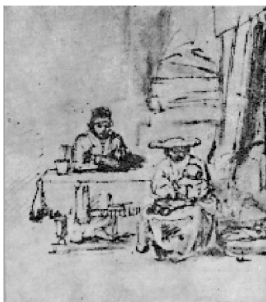
«Sacra Famiglia» (1652 ca.). Vienna, Albertina