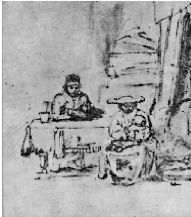
«Sacra Famiglia» (1652 ca.). Vienna, Albertina